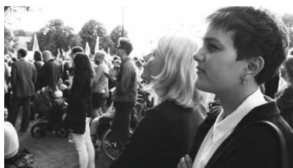
Årets Almedalsvecka var rekordstor – och nästa år, som är valår, beräknas bli ännu större.