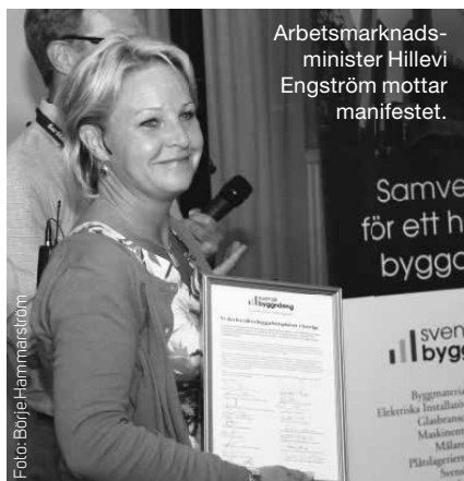
Arbetsmarknadsminister Hillevi Engström mottar manifestet.

Ingen ska förolyckas på sin arbetsplats på grund av säkerhetsbrister. Det är målet med den avsiktsförklaring som företrädare för 17 organisationer (däribland TMF) inom svensk byggsektor tagit fram. Den 2 juni överlämnades denna till arbetsmarknadsminister Hillevi Engström.