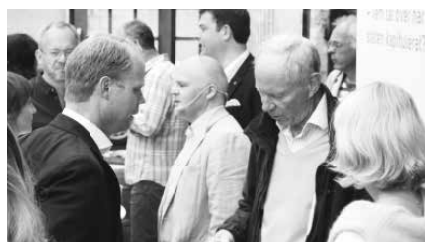
TMF:s seminarier lockade fulla salonger och gav goda tillfällen att knyta kontakter och nätverk.

– Jag är imponerad av det ansvar som den svenska byggbranschen tar. Det är såvitt jag vet första gången som branschen genomför en sådan här manifestation och jag gratulerar till det initiativet, sa Hillevi Engström, arbetsmarknadsminister, när hon tog emot avsiktsförklaringen.