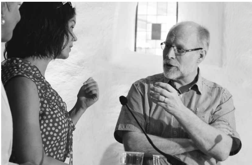
Veronica Palm (S) och Stefan Attefall (KD) i en omdiskuterad fråga. "Det räcker inte med en politik som förlitar sig till marknaden när man som liten aktör inte kan få lån för byggande", menade Palm.