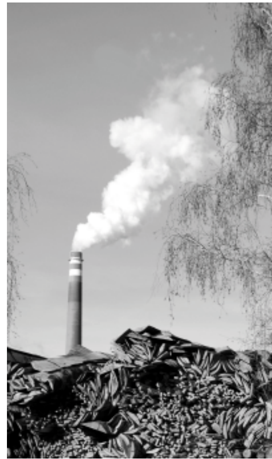
Energisektorn drar nytta av subventioner som gör det mer gynnsamt att köpa vedråvara om det ska användas till värmeproduktion än om det ska användas inom andra områden.

de till de kommunala fjärrvärmenäten, vilket skulle ge träindustrin rättvisare spelregler. Det pågår för närvarande en regeringsutredning som ser över den möjligheten. Företagsledare inom skivindustrin har också med TMF:s hjälp skrivit under en debattartikel med krav på rättvisare villkor, som till exempel har publicerats i Västerbottens-Kuriren.