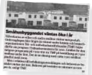
Dagens Nyheter skriver om TMF:s Trähusbarometer.