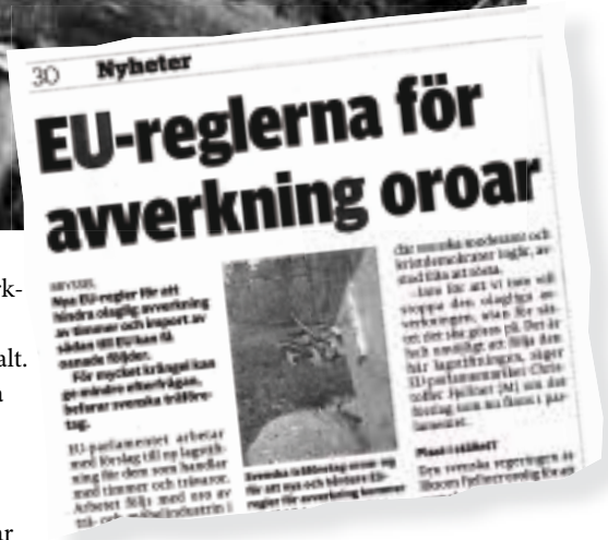
Tidningen Byggvärlden skriver om EU:s förslag om illegal avverkning och att det kan medföra byråkratiskt krångel för träföretagen.

aktörer som först placerar timmer på marknaden ser ut att få krav att dokumentera virkets ursprung och att det avverkats legalt. I resten av värdekedjan ser det ut att räcka med att kunna visa upp en faktura på var virket har inhandlats. TMF har varit aktivt med att uppvakta flera ledamöter i EU:s miljöutskott och har också lyft frågan i media.