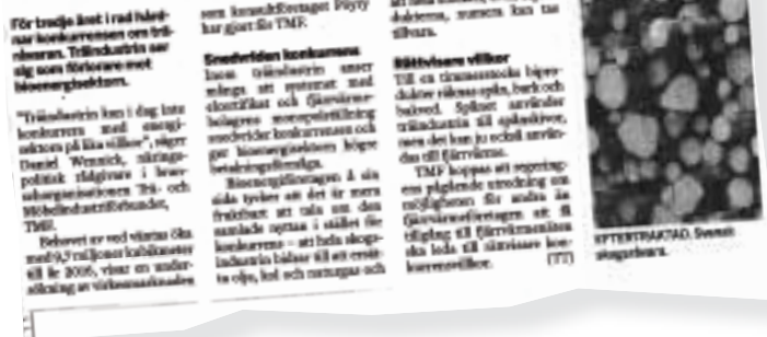
Resultaten från TMF:s undersökning om vedråvaran syntes i Dagens Industri.